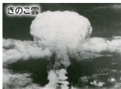
きのこ雲

戦後80年を迎え、戦争の体験や記憶が急速に薄れる中、すべての人の人権が尊重される社会の実現に向けて、「長崎原爆」のパネル展を通して平和の尊さを考えてみませんか。