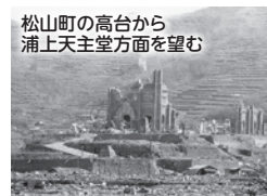
松山町の高台から 浦上天主堂方面を望む