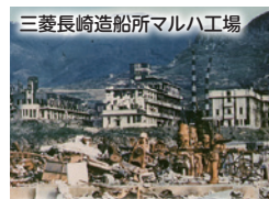
三菱長崎造船所マルハ工場