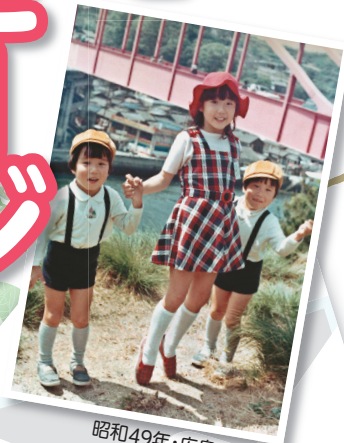
昭和49年・広島・音戸の瀬戸公園で(小4)

「家族と過ごした13年、家族がふたたび、写真のように幸せに暮らせる日々を願って」