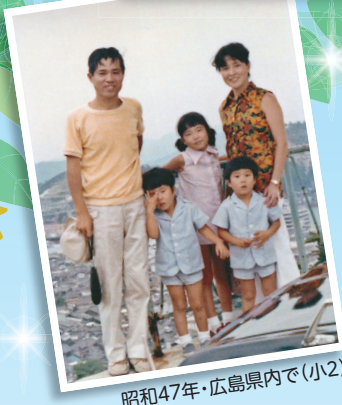
昭和47年・広島県内で(小2)